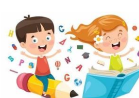
Ed. Infantil 5 años