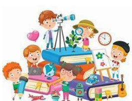
Ed. Infantil 4 años