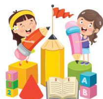
Ed. Infantil 3 años